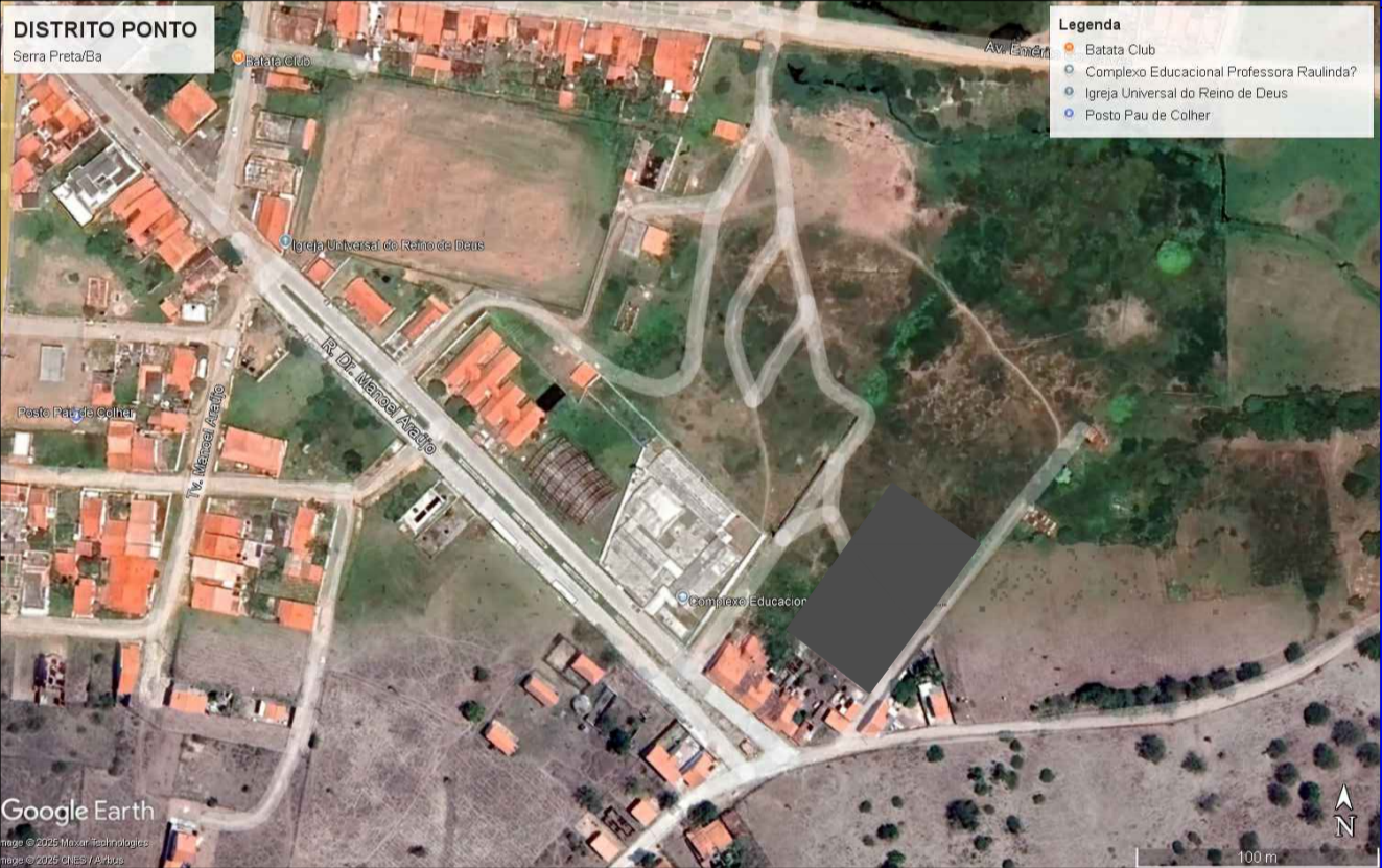
02 PLANTA DE LOCALIZAÇÃO -12.137021° / -39.331745°